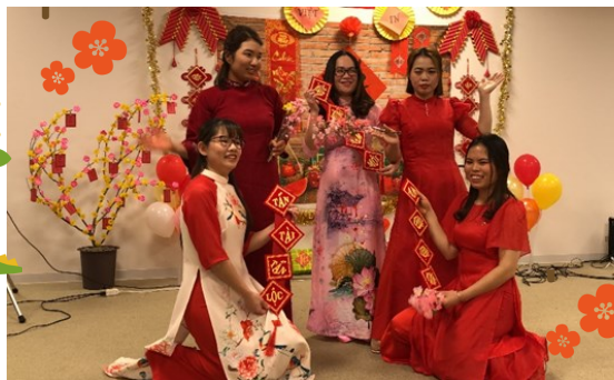
↑ダンスを披露したメンバーで(^_^) 沢山の拍手をありがとうございました。