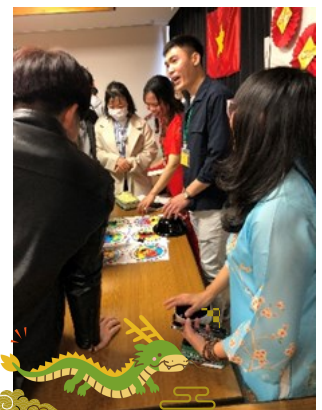
← 飴を使ってサイコロゲーム