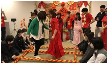
↑リズムカルに遊ぶバンブーダンス

また今年のイベントでは二つの新しい企画を用意しました。まず一つ目は、今治にお店を構える【ベトラボ】さんに「バインミー」というベトナム風サンドイッチとベトナムのコーヒーを販売してもらいました。「バイン・ミー、美味しいです」と皆さんに行っていただけで、私もとても嬉しかったです。二つ目はバンブーダンスというベトナムの伝統的なダンスを参加者の方に体験してもらったことです。皆さんとても楽しんでいました。