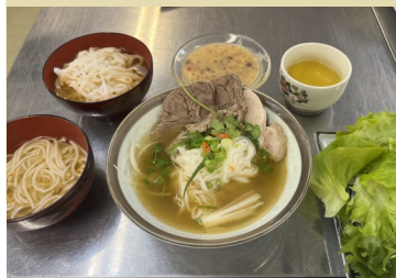
メニュー:ブン・ポー・フエ ベトナムぜんざい(チーフ)