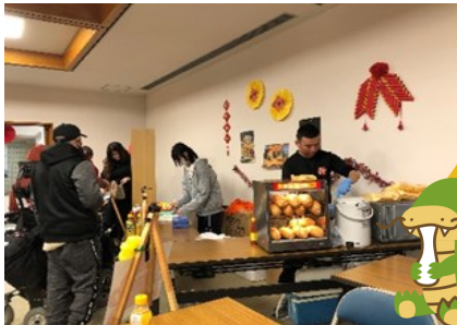
↑今治市から「ベトラボ」さんに来ていただきました。バインミーが大人気ですぐに売り切れていました！

最後になりますが、「新年あけましておめでとうございます」。皆さんのご健康とご多幸をお祈り申し上げます。また今年度には外国人との交流や文化紹介講座、料理教室等を行うので、ぜひご参加ください。XIN CAM ON!