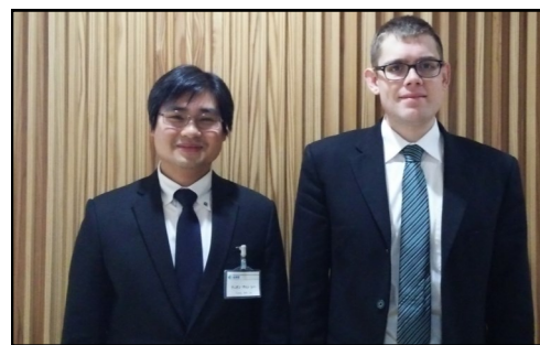
会員申込みを楽しみにお待ちしております！

化を知り視野を広げる」「コミュニケーション能力の向上」「新しい自分、新しい西条の発見」「日本や西条市の事を海外に紹介する」国際交流協会を通して、そのイメージを実現できます！